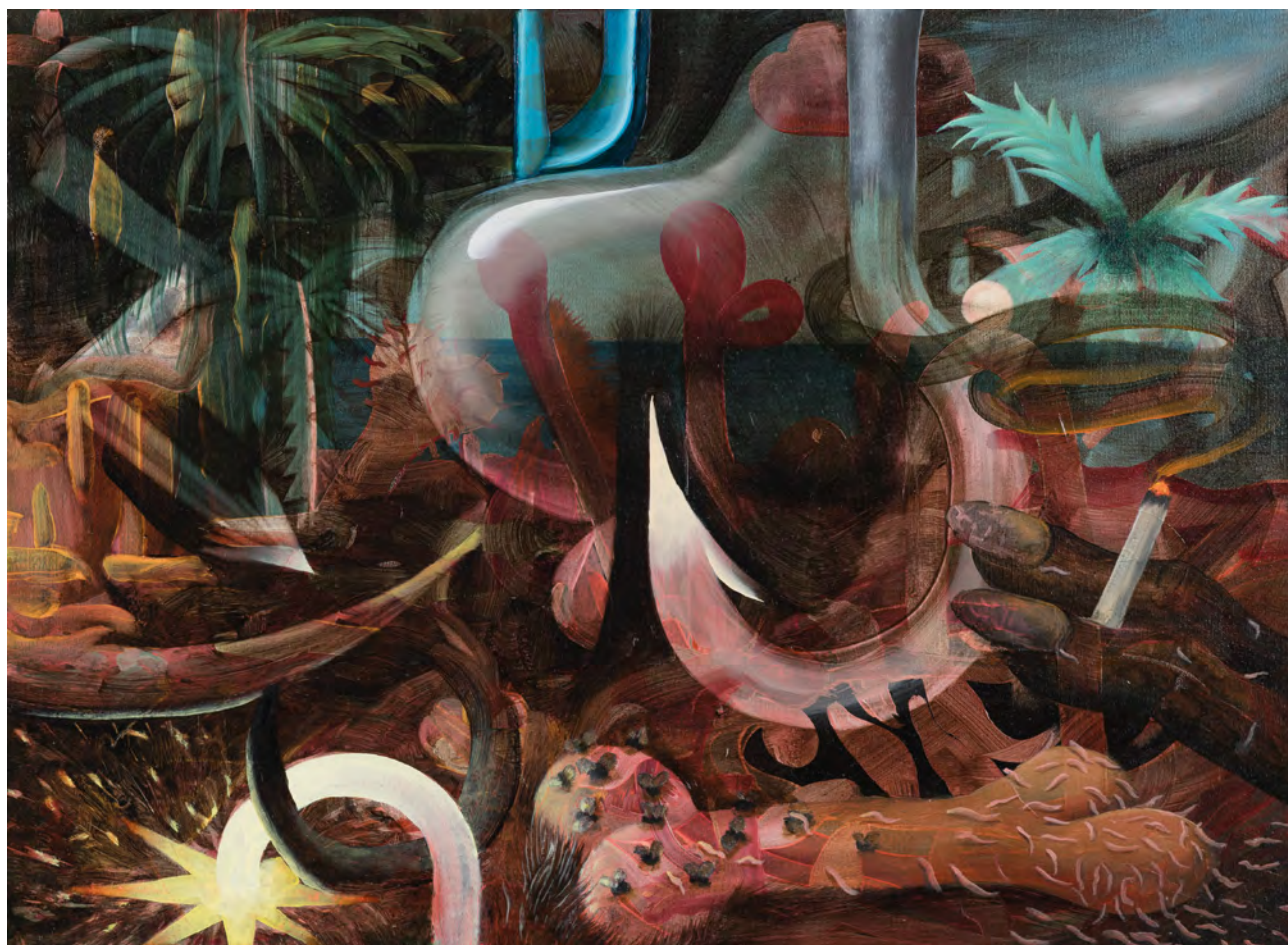
↑ Dawid Czycz, WITH CIGARETTE , olej/plótno (oil/canvas) 45 × 60 cm, 2019